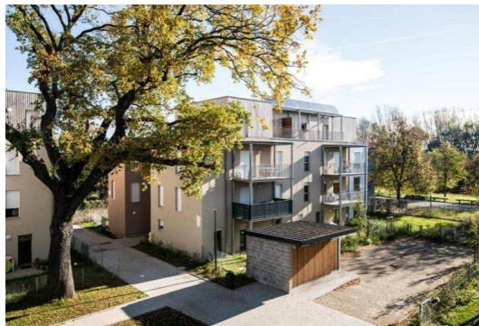
éco-quartier des berges de la Doller à Bourztwiller